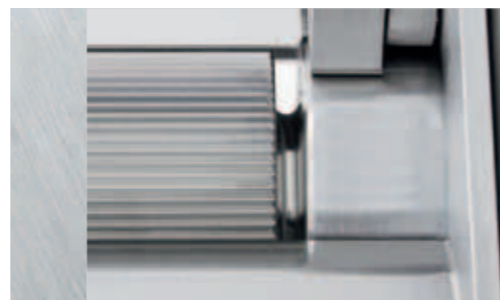
Reinigungsfreundliche Bauweise: Hygieradius an der Transport- und Abstreiferwalze