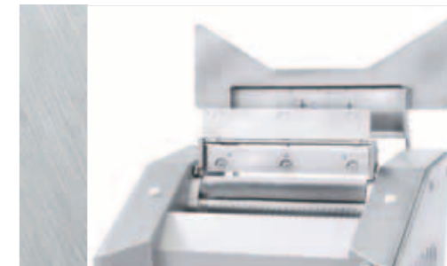
EVM 5006: Reinigungsstellung