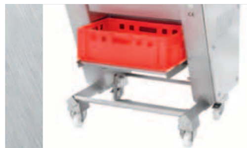
EVM 5006: Kübelaufgabe in oberster Stellung